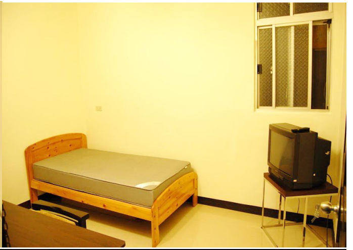
小雅房 B-室內(已換液晶 24")